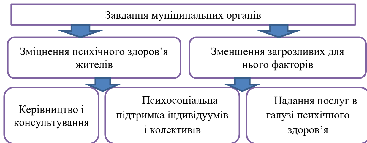
Рис. 3. Завдання муніципальних органів

Завданням муніципальних органів є зміцнення психічного здоров'я жителів і зменшення загрозливих для нього факторів. Ця робота включає в себе керівництво і консультування, психосоціальну підтримку індивідуумів і колективів, а також надання послуг в галузі психічного здоров'я (рис. 3) [16].