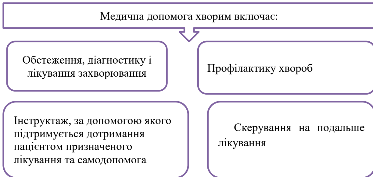
Рисунк 1. Комплекс медичної допомоги хворим у Фінляндії.

Медичний догляд повинен здійснюватися відповідно до встановлених медициною потреб пацієнта, а також з наявними загальними підставами для лікування. У разі необхідності повинен складатися диференційований план лікування.